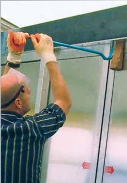
Contrôle de la résistance par un expert